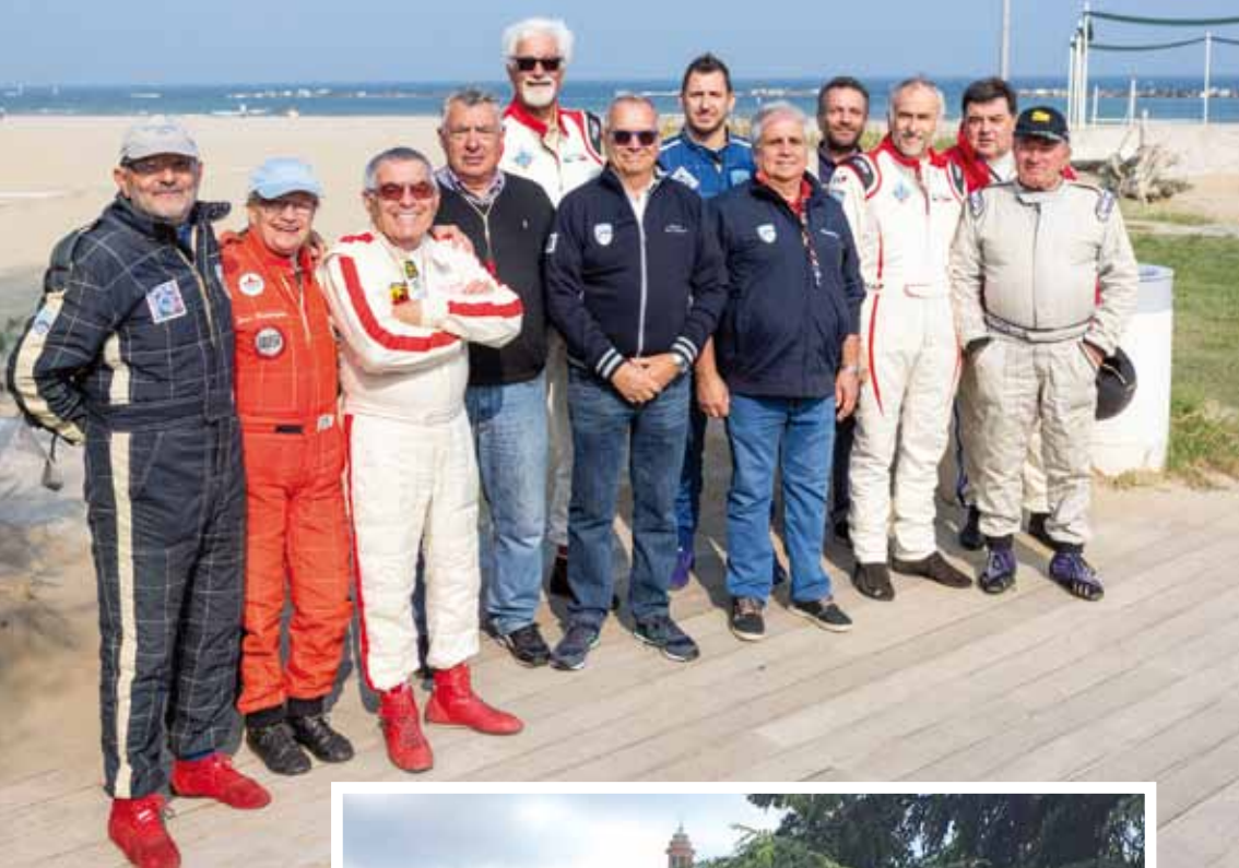
Momenti di relax alla Coppa del Faro e alla Bologna-San Luca